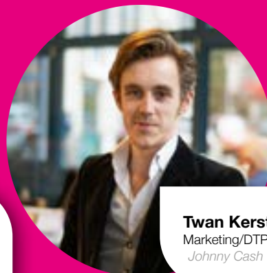
Twan Kersten Marketing/DTP Johnny Cash van de DTP